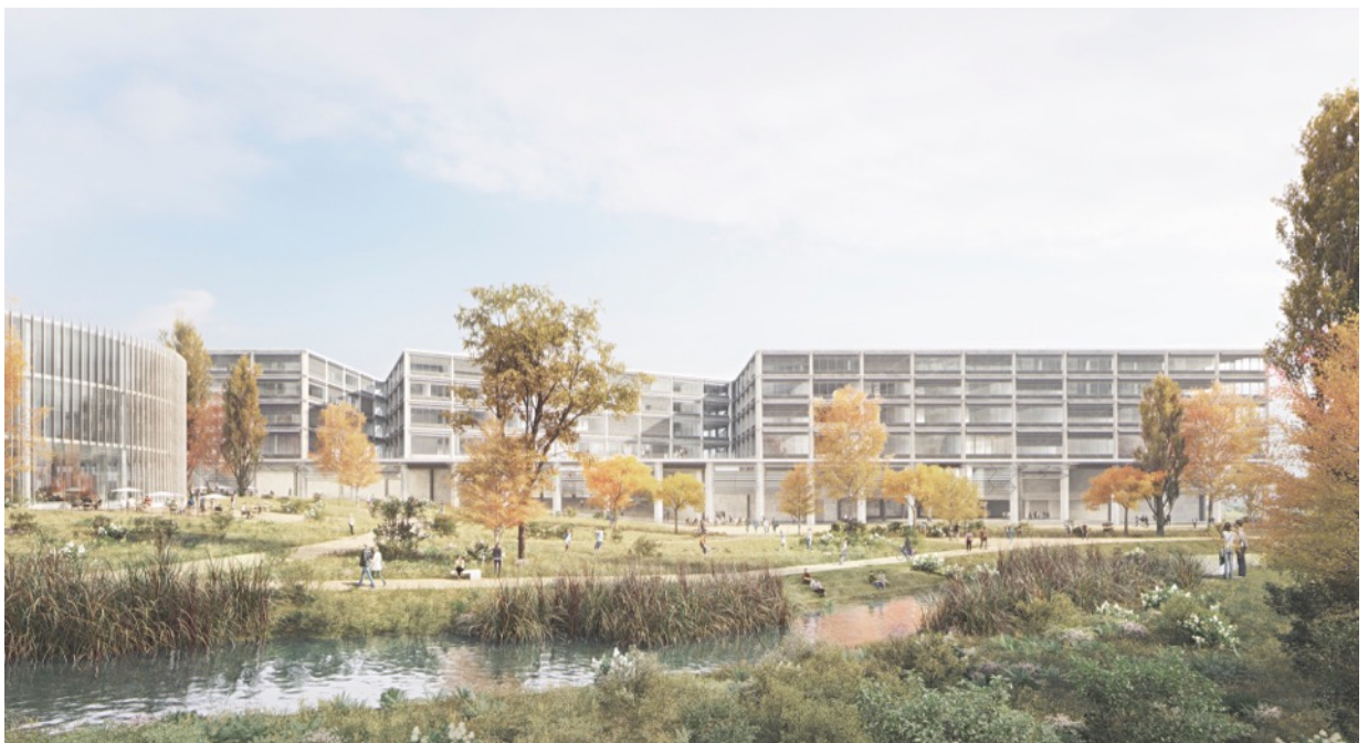
Ab 2026 die Heimat von rund 6000 Studierenden, Dozierenden und Mitarbeitenden der Berner Fachhochschule: Das Projekt «Dreierlei» eines Generalplanerteams unter der Leitung der wulf architekten gmbh aus Stuttgart (D).