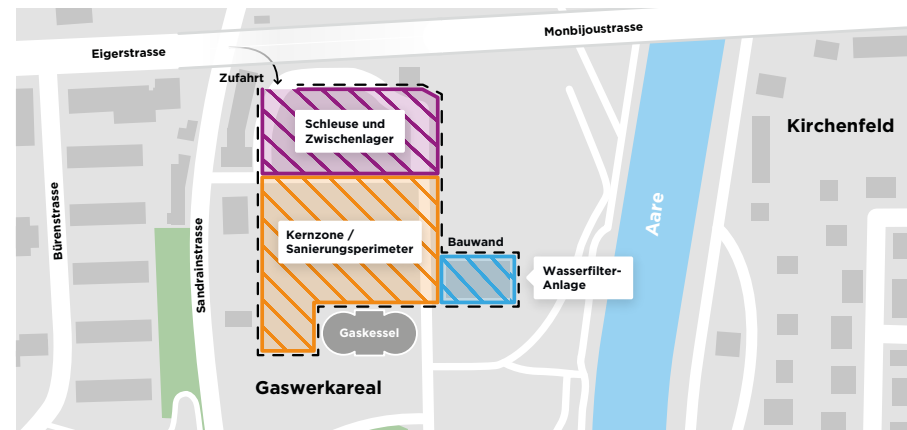
Bauperimeter Gaswerkareal Sandrain

Alle Infos zum Projekt Sanierung Gaswerkareal finden Sie ab August 2021 online auf sandrain.be