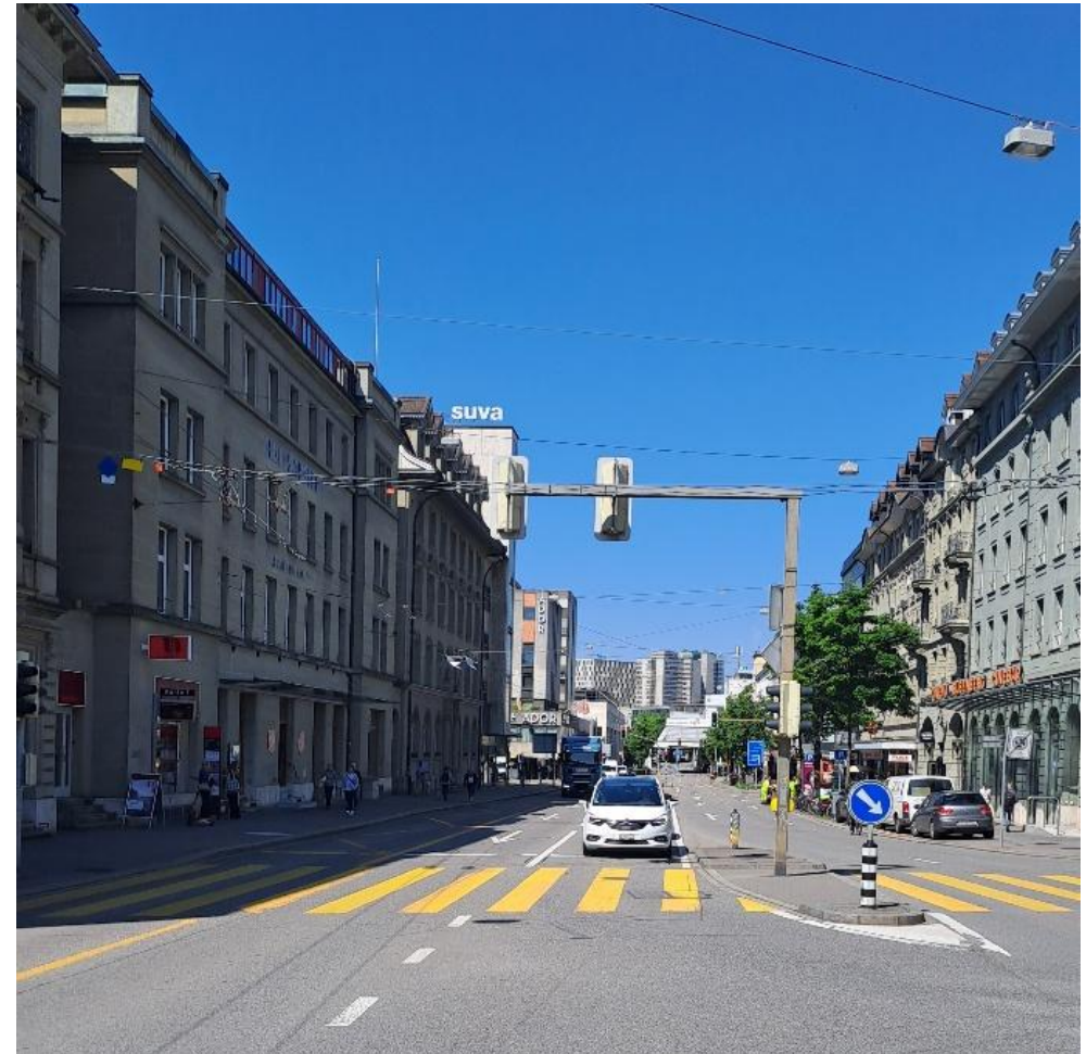
Hier entlang der Laupenstrasse könnte eine neue Gleisverbindung eine Entlastung des Hirschengrabens bringen.