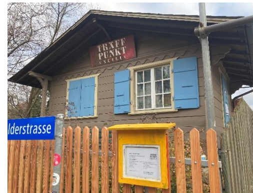
Und die neue Aussengestaltung des Quartierlokals am Cäcilienplatz.