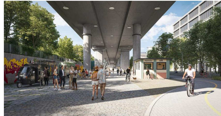
Visualisierung wie der Raum unter dem Viadukt aussehen könnte. (Grafik: Bryum)