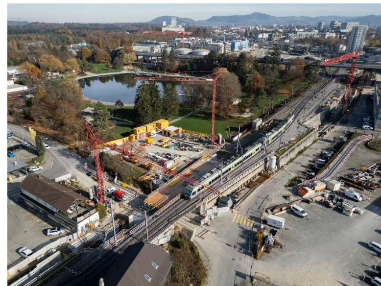
Baustelle der SBB im Weyermannshaus