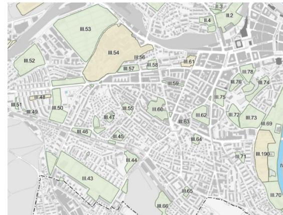
Die ZÖN-Revision betrifft viele Gebiete im Stadtteil 3 (Grafik: Stadtplanungsamt Bern)

Die Vorlage wurde im Rahmen der Mitwirkung in der QM3-Arbeitsgruppe vom 17. November 2025 den Delegierten vorgestellt. Die QM3 wird 2026 eine Stellungnahme erarbeiten und online einreichen.