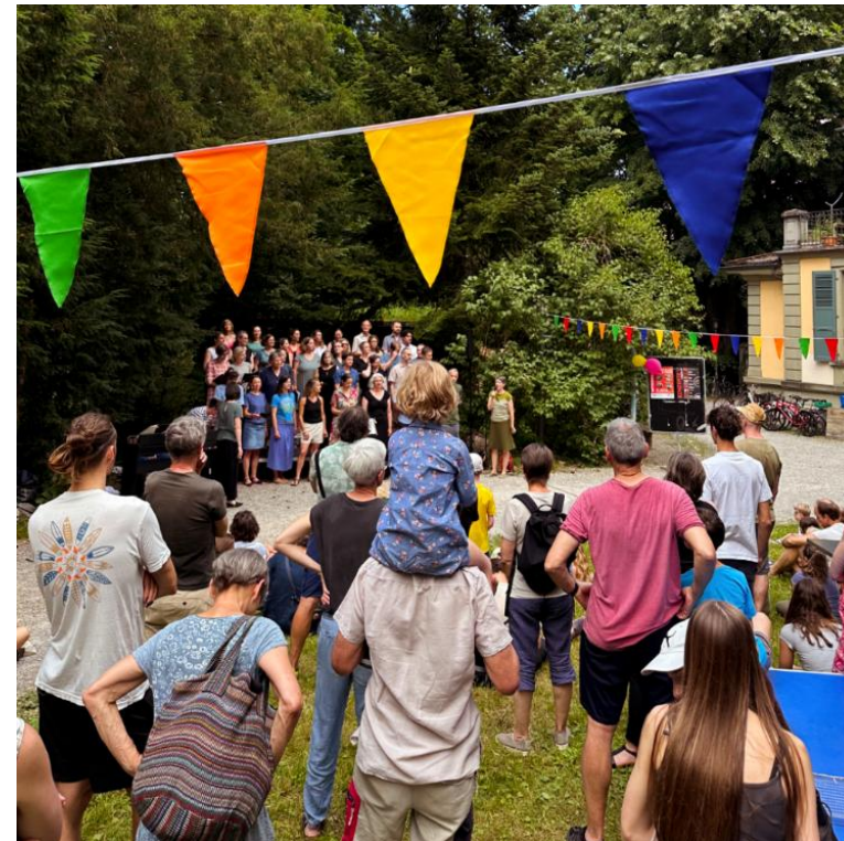
Das Mittsommerfest in der Villa Stucki war ein voller Erfolg...

Ein Gesuch vom Verein Raum Hueber wurde ebenso abgelehnt. Der Vorstand genehmigte den Antrag nicht. Die Begründung lautet, dass die Verflechtung zwischen der Genossenschaft CAFE HUEBER, die die Cafébar führt und den Sitzungsraum vermietet, und dem Verein RAUM HUEBER, der das Veranstaltungs-Programm organisiert, unklar ist. Zudem genehmigt der Vorstand in der Regel nur einen Teil der anfallenden Kosten und nicht die Gesamtkosten.