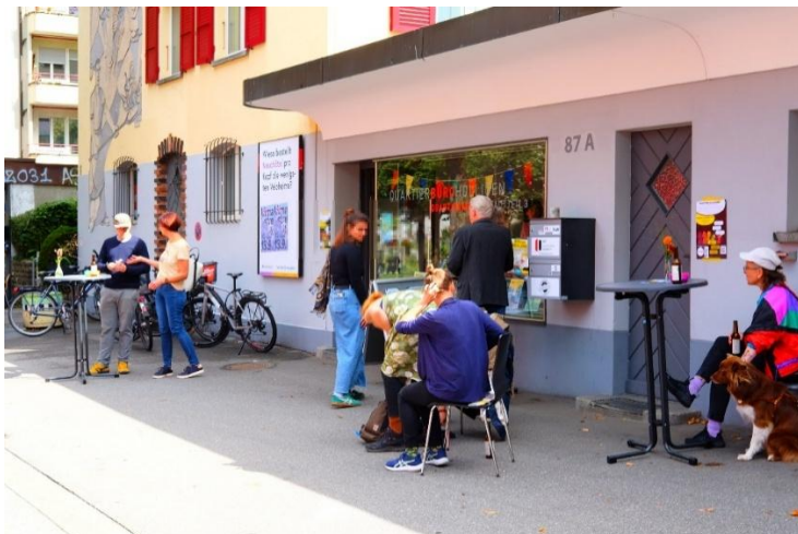
Und die Quartierplauderei...