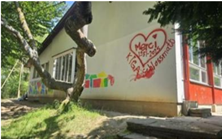
Das Personal nahm Abschied vom alten Kindergarten Schlossmatt.

- Die Bauarbeiten des Kindergartens Schlossmatt begannen im August 2025 und dauern voraussichtlich zwei Jahre. Der reguläre Betrieb der neuen Basisstufe Schlossmatt startet nach den Sommerferien 2027. Während der Bauzeit werden die beiden bestehenden Klassen vorübergehend in die Schulanlage Steigerhubel verlegt. Die Stimmberechtigten der Stadt Bern haben am 9. Februar 2025 den Baukredit von 8,41 Millionen Franken für die Erweiterung genehmigt.