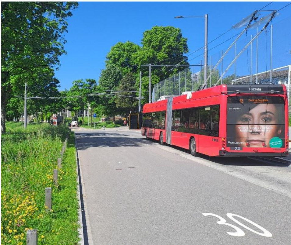
Die Buslinie 12 soll bis zum Europaplatz weitergezogen werden.

- 2025 wurden im Stadtteil 3 wiederum neue Begegnungszonen bewilligt. Der Gemeinderat hat beschlossen, folgende Strassen in solche Zonen umzuwandeln: Es betrifft die Holligenstrasse, die Könizstrasse (Seitenarm) sowie die Lentulusstrasse-Weberstrasse-Niggelerstrasse-Cäcilienstrasse-Eichmattweg. Die Umsetzung ist für Herbst 2025 und Frühling 2026 vorgesehen.