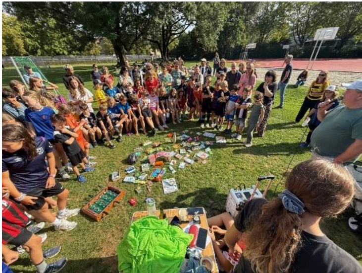
Ebenso der Marzili-Cup...